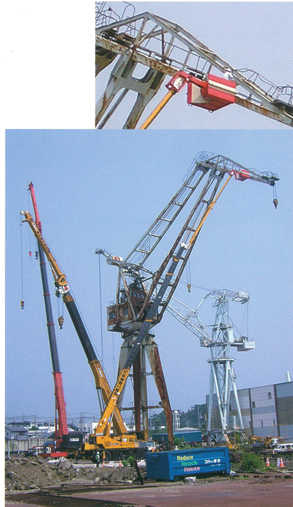
造船所クレーン解体 50m作業 50Tラフター