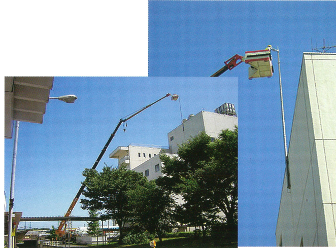
避雷針交換作業 半径30m 50Tラフター