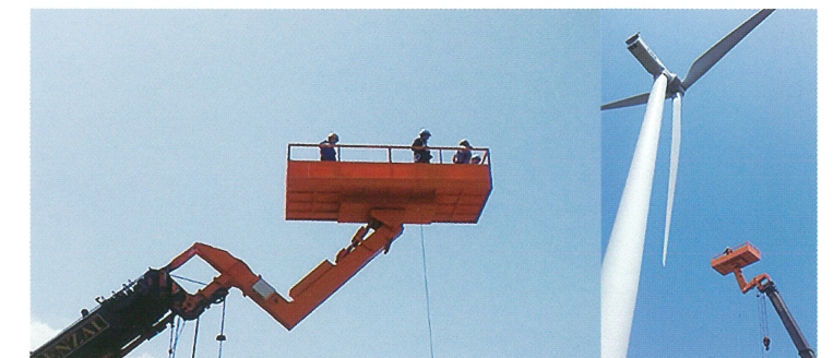
風力発電機 メンテナンス SS-450 60Tラフター取付