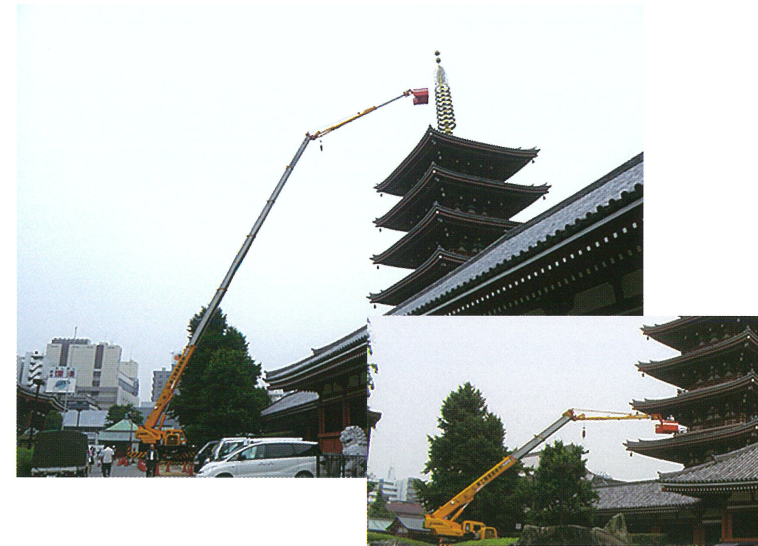
五重塔メンテナンス 50m作業 60Tラフター