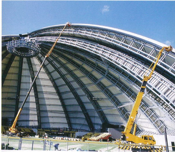
ドーム塗装 55m作業 50Tラフター