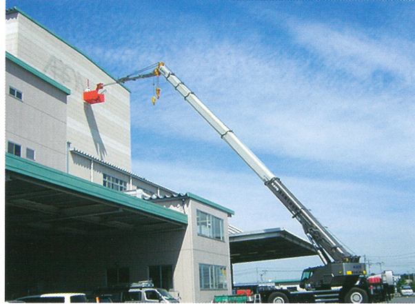
倉庫看板作業 半径30m 50Tラフター