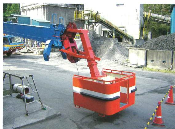
200T フルオートジブ取付

ボックスの外側は鋼板で囲い、高所においての搭乗者の風よけと恐怖心を少なくしています