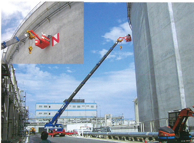
LNGタンク看板作業 半径25m 50Tラフター