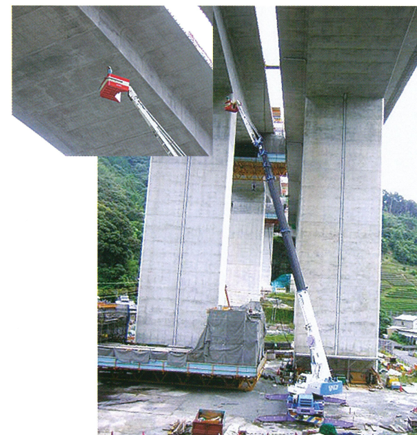
高速道 橋桁点検 40m作業 50Tラフター