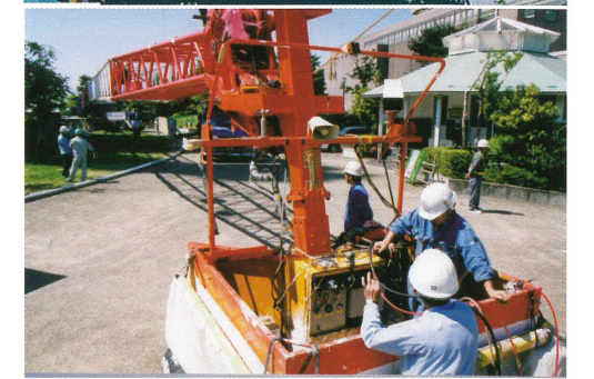
100m観音像リニューアル 100m作業 360Tクレーン