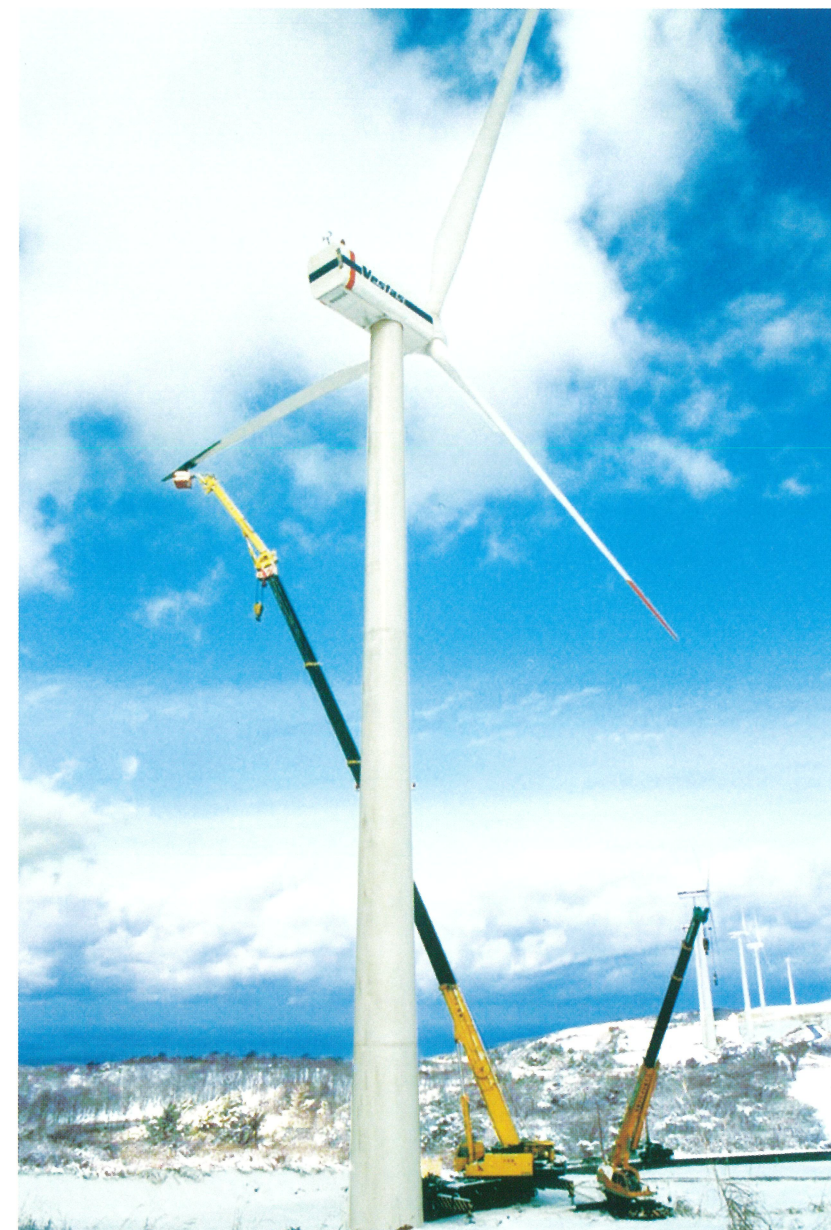
200Tフルオートジブ装着